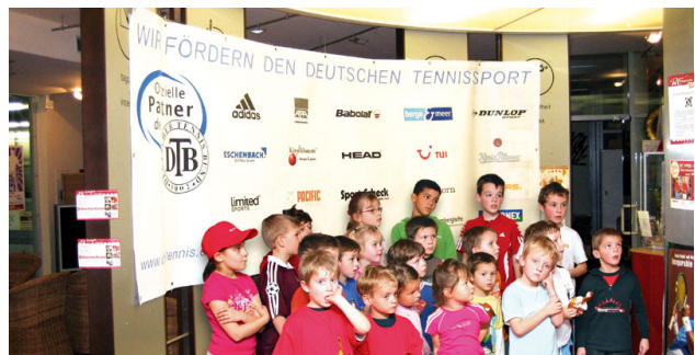
ITF-Herrenturnier 15.000US$ + H in Nußloch 2007