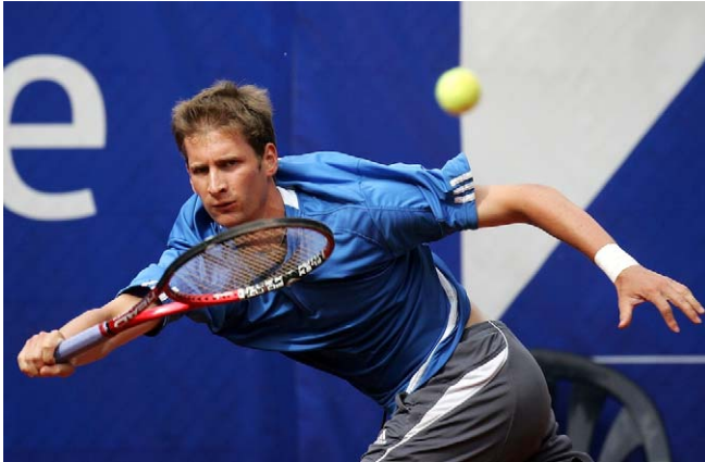
Florian Mayer (1.FC Nürnberg)

Auf der Tennisanlage im Dresdner Wildpark startete die dritte Auflage um den Ostdeutschen Sparkassencup vom 5. Mai bis 13. Mai 2007. Das einzige ATP-Challenger-Turnier in Ostdeutschland wurde vom Tennisclub Blau-Weiß Dresden-Blasewitz ausgerichtet, war mit 42.500 Euro Preisgeld dotiert gewesen. Während der neun Turniertage wurde im Dresdner Waldpark Spitzentennis geboten.