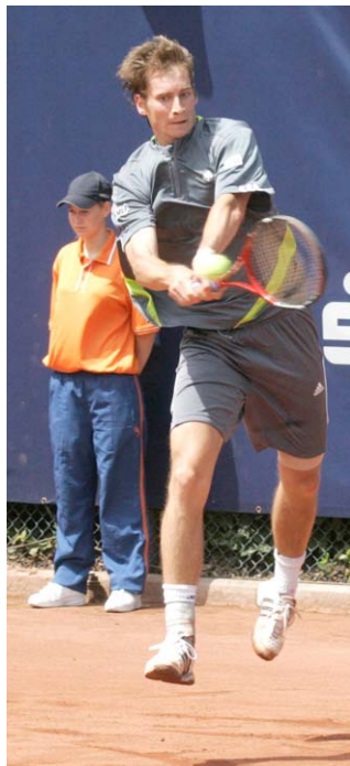
Finalist Florian Mayer

Florian Mayer zeigte sich ein wenig enttäuscht von