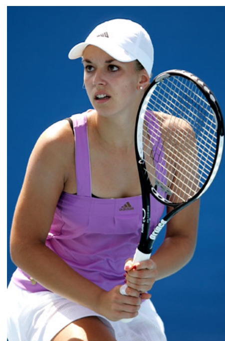
Sabine Lisicki bei den Australian Open 2008

Das Ziel für 2008 ist jedenfalls klar: So schnell wie möglich unter die Top 100 zu kommen. Wenn sie so weitermacht, dann dürfte ihr das auf jeden Fall schon bald gelingen.