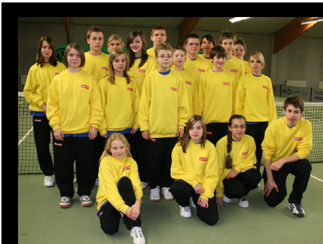
5. Volkswagen Challenger Wolfsburg ATP-Challenger 35.000 US$+ Hospitality

Wichtige Helfer auf dem Platz - die Ballkinder vom 5. Volkswagen Challenger in Wolfsburg.