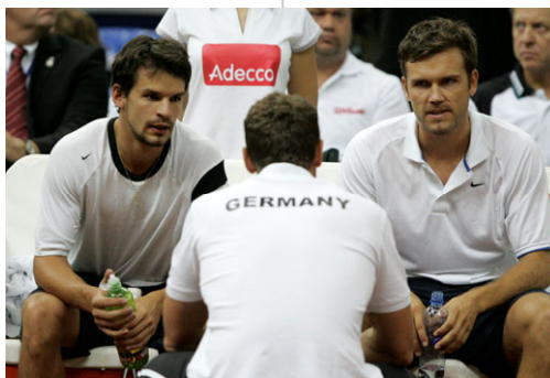
v.l.: Philipp Petzschner, Teamchef Patrik Kühnen und Alexander Waske beim Davis Cup Halbfinale in Moskau 2007.